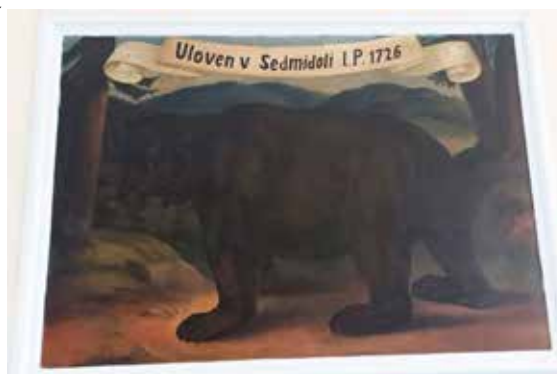
Snímek obrazu posledního zastřeleného medvěda v Krkonoších.