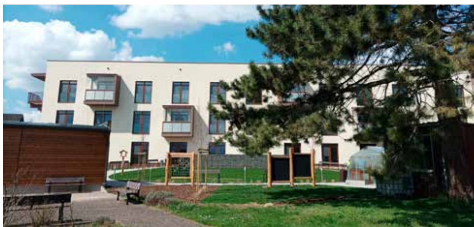
Nový dům pro seniory ve Vrchlábí.