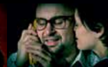
Smrt a dívka